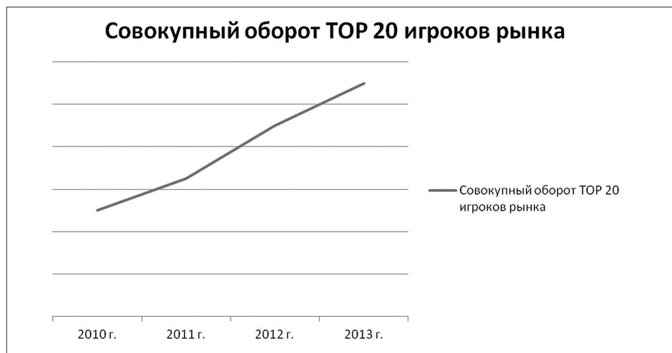
Рис. 2. Тенденции роста совокупного оборота основных игроков рынка информационной безопасности